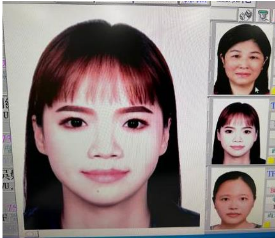
旅行社掃描上傳-偏斜、色澤、裁切過多