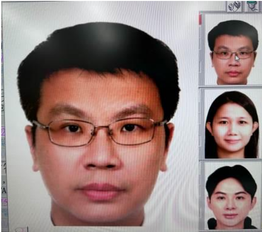
旅行社掃描上傳-頭像過大、裁切過多