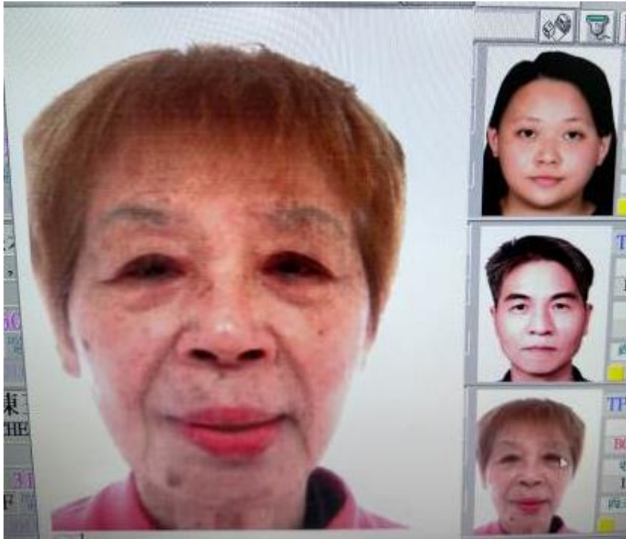
旅行社掃描上傳-切頭、裁切過多