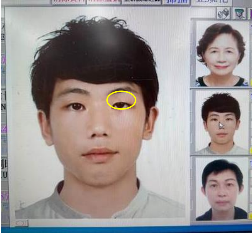
旅行社掃描上傳-眼部髒污