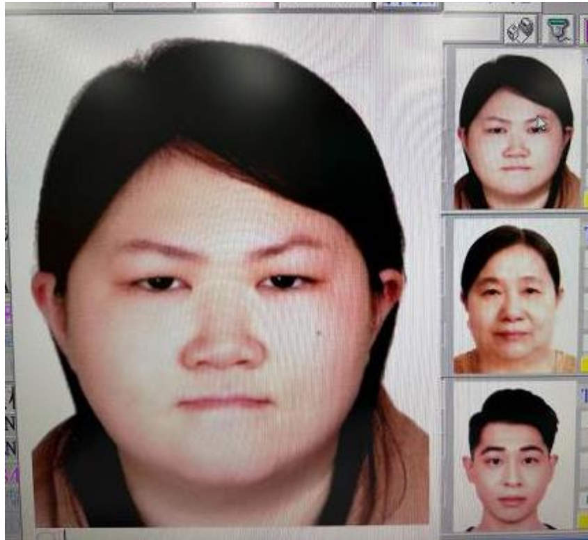
旅行社掃描上傳-頭像過大、裁切過多