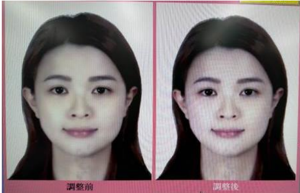
旅行社掃描上傳-色差