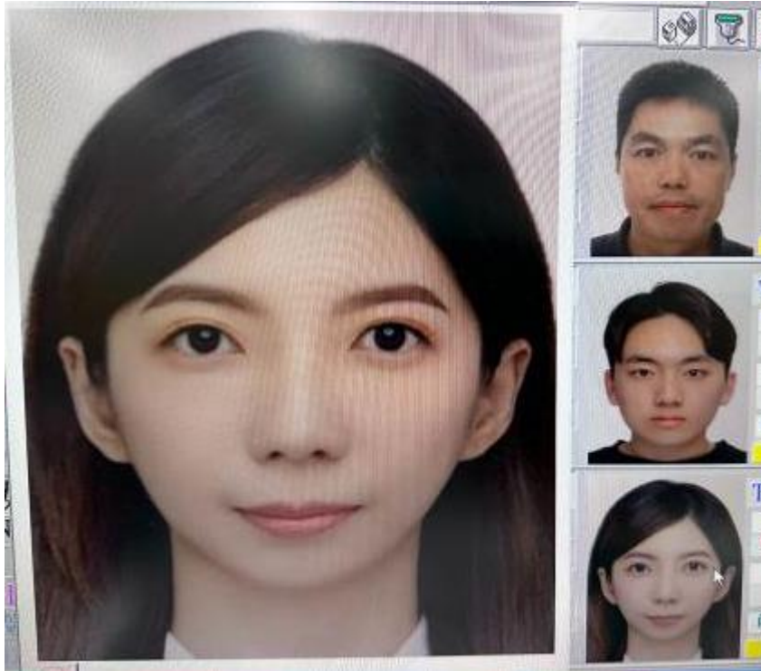
旅行社掃描上傳-底色