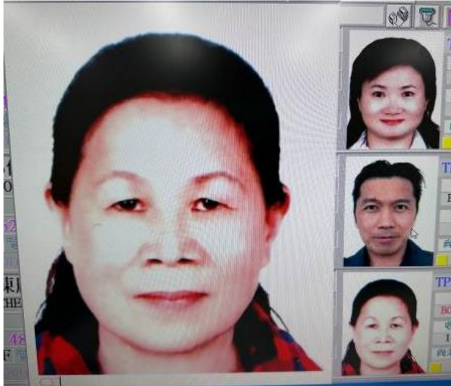
旅行社掃描上傳-色澤