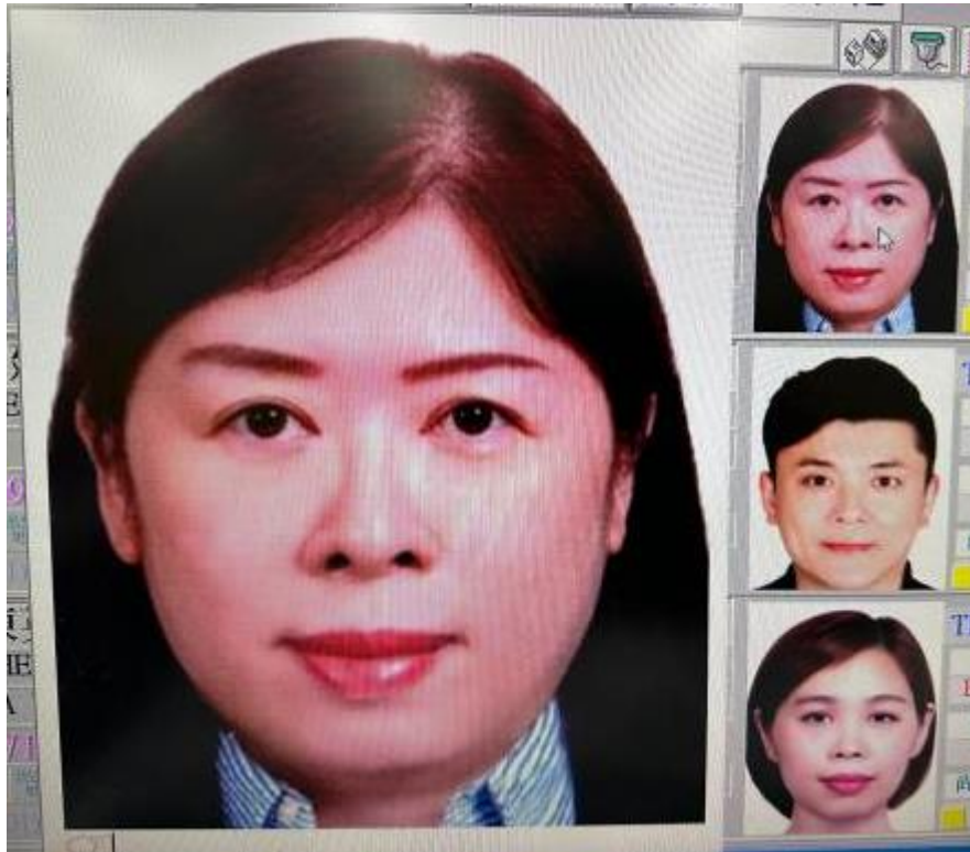
旅行社掃描上傳-頭像過大、裁切過多