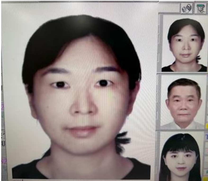
旅行社掃描上傳-模糊