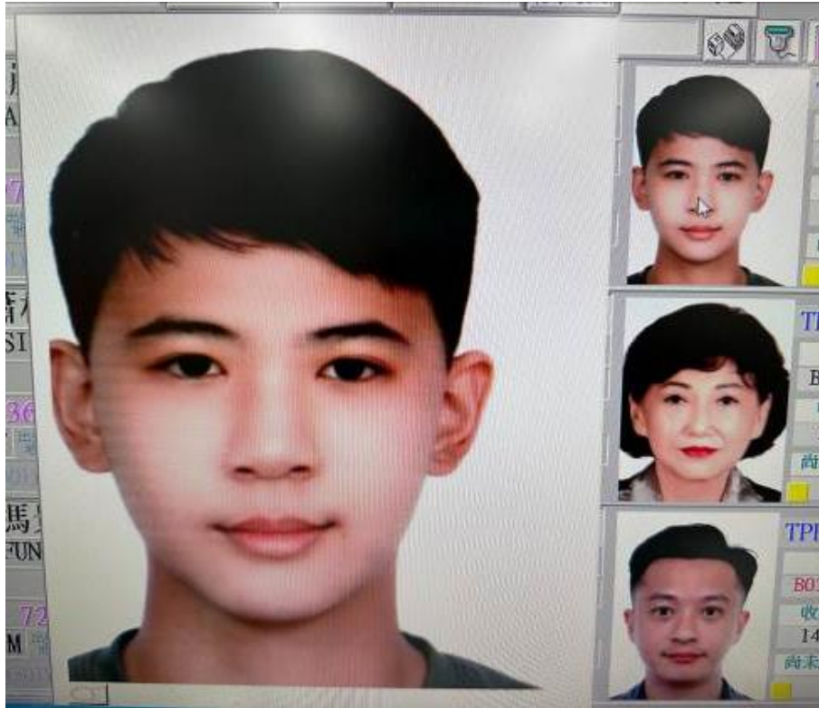
旅行社掃描上傳-偏斜