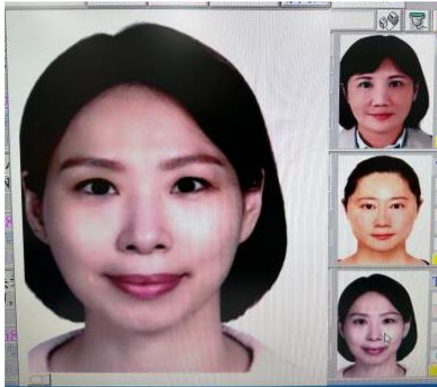
旅行社掃描上傳-切頭、裁切過多