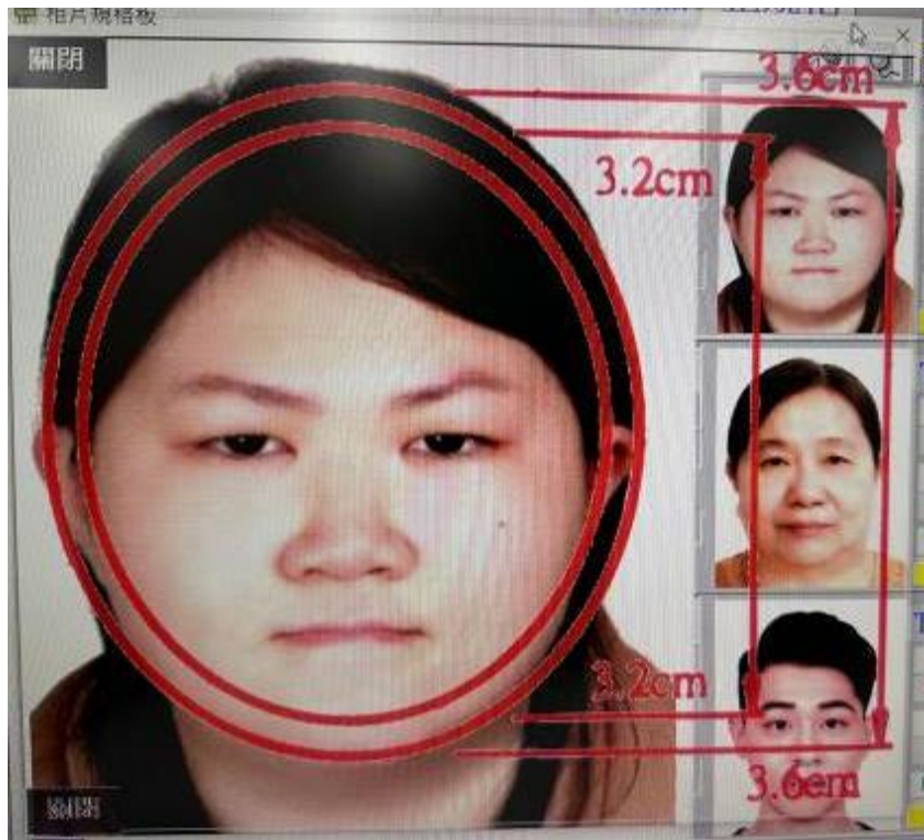
旅行社掃描上傳-頭像過大、裁切過多