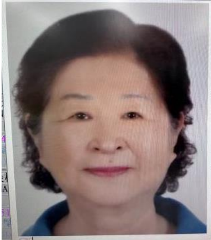
旅行社掃描上傳-底色